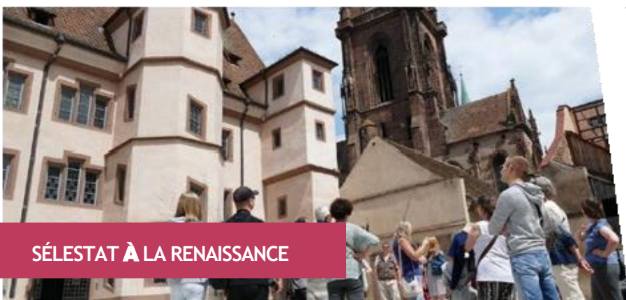
SÉLESTAT À LA RENAISSANCE