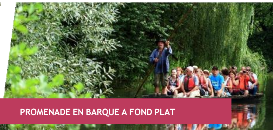
PROMENADE EN BARQUE A FOND PLAT