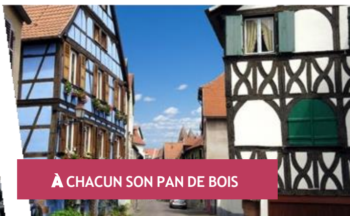
À CHACUN SON PAN DE BOIS