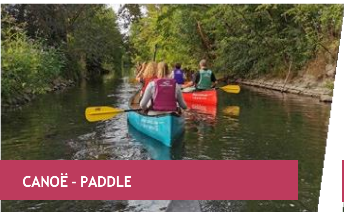
CANOË - PADDLE

Vous souhaitez plus de sensations, que vous soyez sportif ou non, le centre Alsace a l'activité qu'il vous faut ! Faites votre choix