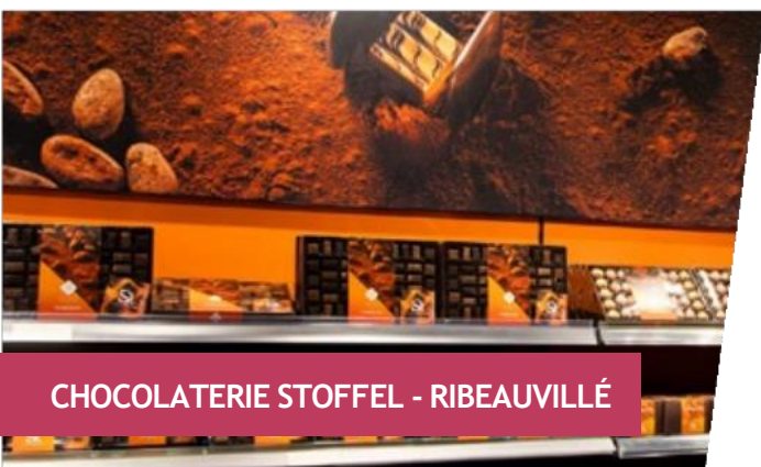
CHOCOLATERIE STOFFEL - RIBEAUVILLÉ