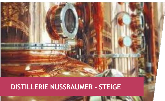
DISTILLERIE NUSSBAUMER - STEIGE

Amateurs de produits du terroir, de moments de partage savoureux, le centre Alsace saura surprendre vos papilles !