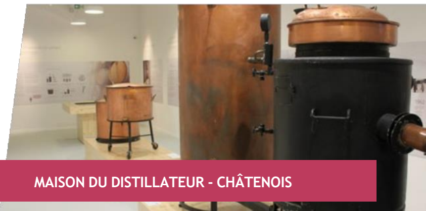
MAISON DU DISTILLATEUR - CHÂTENOIS