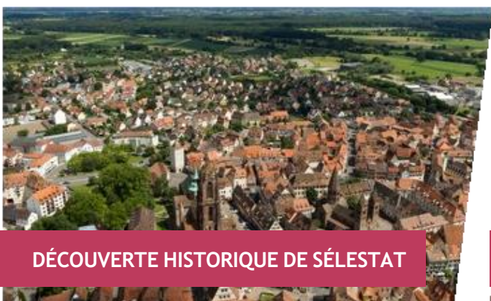
DÉCOUVERTE HISTORIQUE DE SÉLESTAT