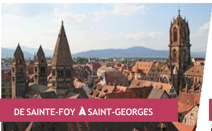
DE SAINTE-FOY À SAINT-GEORGES