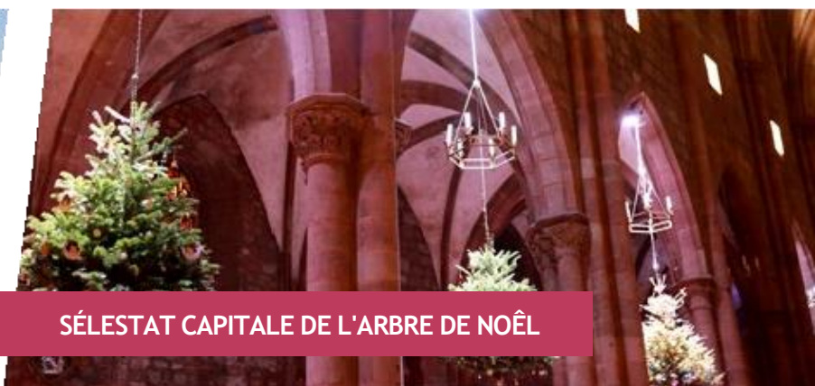
SÉLESTAT CAPITALE DE L'ARBRE DE NOËL