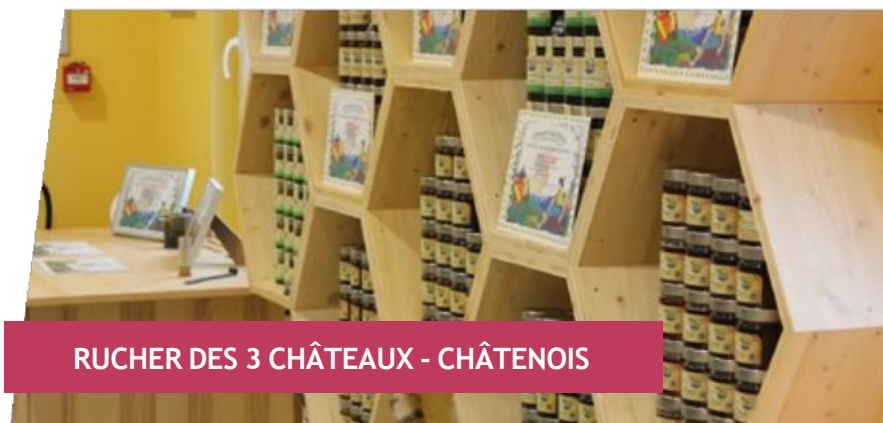
UCHER DES 3 CHÂTEAUX - CHÂTENOIS