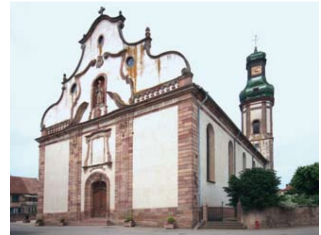
Eglise Saint-Martin : Façade, pignon à volutes et clocher à bulbe