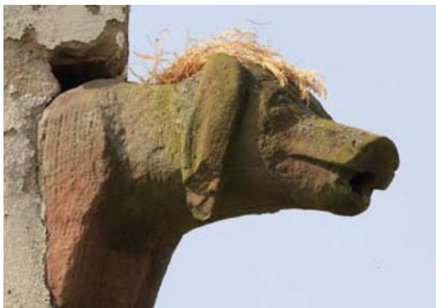
Chapelle de la Feldlach : Gargouille

La terrasse de la Plaine d'Alsace est visible du côté de la chapelle du Feldlach, en quittant le sentier, au niveau du moulin, vers le nord. Cette terrasse, d'origine rhénane, est une des terres les plus riches d'Alsace. Déjà Plinie l'Ancien disait que cette terre riche permet à l'Alsace d'être le grenier de l'Europe. Actuellement, on y cultive principalement le maïs, mais aussi le blé, le tabac, le chou et la pomme de terre.