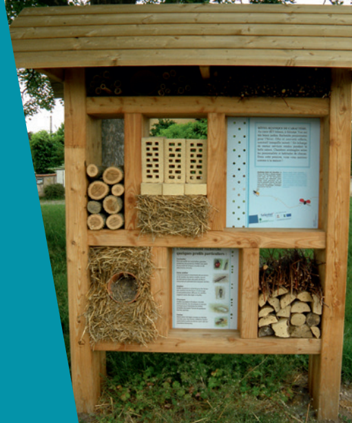
Hôtel à insectes • Station n°5